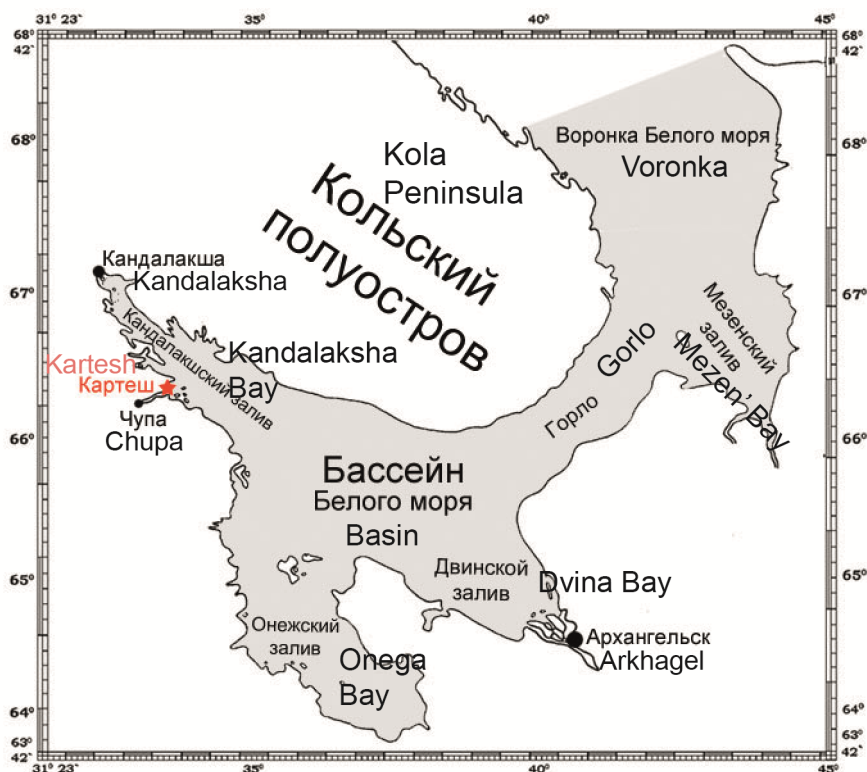
Рис. 1. Картограмма Белого моря. Звездочкой показано место поимки камчатского краба в районе Беломорской биостанции «Мыс Картеш».

характеристики абиотических условий места поимки следует считать приблизительными.