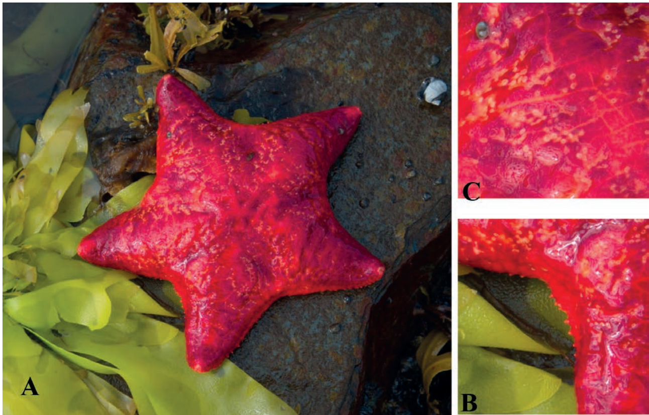
Рис. 1. Внешний вид морской звезды Porania pulvillus (O.F. Müller, 1776), пойманной в губе Малая Волоковая (А), папулы (В), маргинальные пластины (С).

2016], представители этого вида имеют типичную пятилучевую форму, тело звезды плотное, центральный диск широкий, куполообразный. Спинная сторона затянута сплошным кожным покровом, лишённым известковых образований, и представляется абсолютно гладкой. В отличие от других баренцевоморских представителей семейства Poraniidae , спинная сторона которых плотно гранулирована (р. Poraniomorpha ), либо снабжена мелкими иголочками (р. Thylaster ). На спинной стороне располагаются многочисленные светлые папулы (жаберные пузырьки), которые хорошо видны у живых экземпляров (рис. 1В). Нижние маргинальные пластины несут от 1 до 5 крепких конических игл, образующих заметный бордюр по периметру диска и лучей (рис. 1С). Цвет варьирует от ярко-красного до желтоватого, иногда присутствуют пятна.