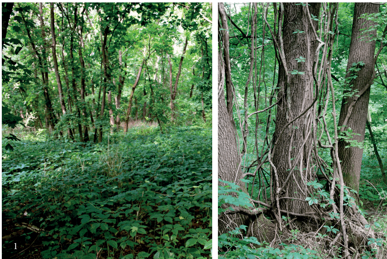
Рис. 3. Синузия P. inserta (1) и его многолетние побеги на стволах Q. robur (2).

1984–1985] позволяет P. inserta занимать вакантную нишу. В пойменном лесу, являясь единственным представителем внеярусной растительности, он поднимается по стволам деревьев первого и второго ярусов на высоту 15–20 м, закрепляясь в неровностях их коры разрастающимися концами усиков. В нижней части побеги ветвятся мало, лишены листьев, в кронах на освещённых местах интенсивно ветвятся и формируют густую листовую мозаику, цветут и плодоносят (рис. 3 (2)). Растение является мощным конкурентом для деревьев первого яруса за свет.